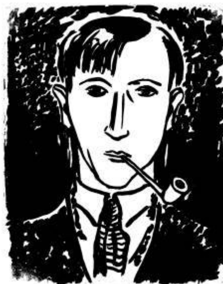
Selvportræt. Sådan illustrerede Wilhelm Freddie sig selv i 1929. Illustration fra bogen.

Så Freddie's grafiske produktion var med til at bane vejen for hans anerkendelse på et tidspunkt, hvor maleriene og skulpturobjekterne blev anset for at være alt