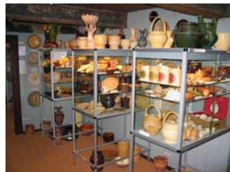
Nordeuropas største lertøjssamling! Et mikroskopisk udsnit af det lille museums store samling af keramik, kagedåser og nipsenåle.