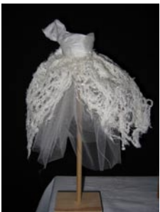
Draperet dronning? Brigid McKay-Holm har fremstillet skulpturen.